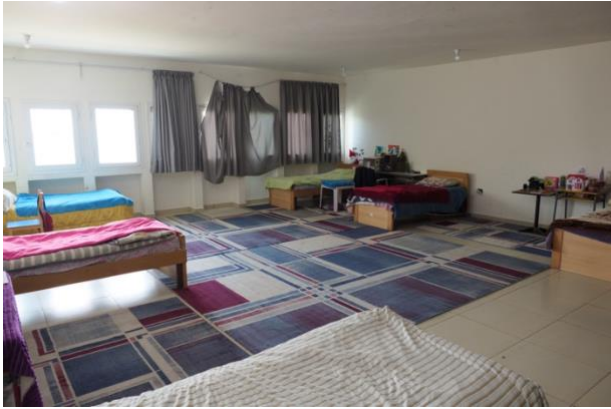
Drengenes sovesal på Home of Hope