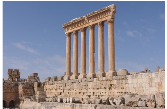
De store søjler i det romerske tempel i Bakaa-dalen

Jeg så og lavede aftaler om besøg på alt fra vuggestuer til alderdomshjem (ikke plejehjem!) og med kirke ledere med fokus på dialog religionerne imellem – og i Libanon er der flere religiøse grupperinger, end man kan forestille sig! Store historiske sightseeing-steder, som det romerske tempelkompleks Baalbek og oldtidsbyen Byblos, blev jeg heller ikke snydt for. De steder og flere andre, bl.a. Kana hvor Jesus gjorde vand til vin, skal vi se på fællesturen.